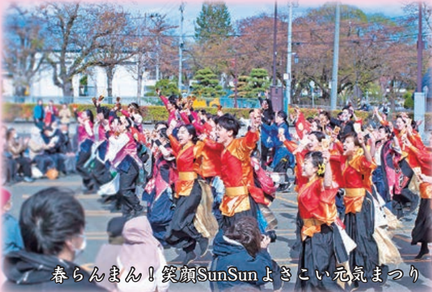
春らんまん！笑顔SunSunよさこい元気まつり

十和田市春まつりが4月20日から5月5日まで開催された。22日・23日には、とわだ自慢市や稲生川ウォーク、4年ぶりとなるカラオケバトルや、よさこい元気まつりなど様々なイベントが行われ、多くの観光客で賑わった。