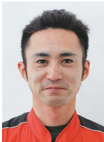
(株)十和田钣金塗装整備工場

入社時は車検を担当しました。検査項目以外でも不具合や乗り方をチェックして、永く乗れるようなアドバイスもします。昨年からは板金塗装を担当し、補修箇所だけでなくその周りまで異常がないか確認し、キレイに仕上がった状態でお客様のもとに届けます。そうやって喜んでいただけた時にやりがいを感じます。車に毎日携われる環境に感謝し、現状に満足することなく、