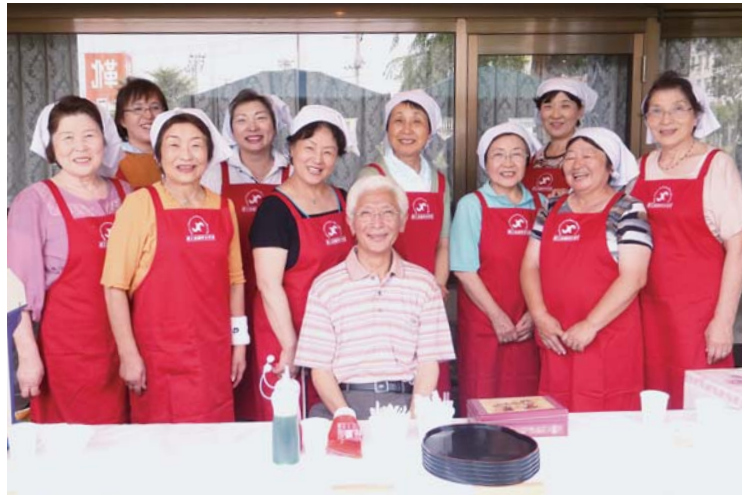
小山田市長も食べに来て下さいました