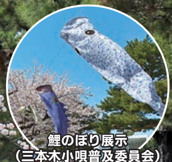
鯉のぼり展示 (三本木小唄普及委員会)