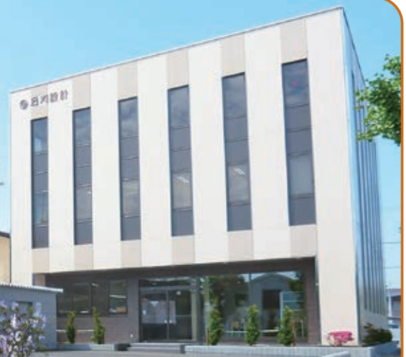
現社屋は平成25年5月末に完成

昭和56年の開設以降、携わったプロジェクトは3,000件超。「技術向上」「迅速対応」「誠実完遂」の品質方針のもと、モノ造りと真摯に向き合い、培ってきた経験と技術を地域へ還元してきた。(株)石川設計が県内トップクラスの設計事務所になり得たのは、そうした取組を積み重ねてきたからである。