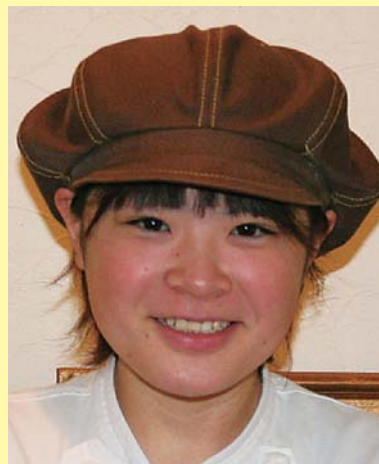
(株)御菓子のみやきん 十和田総本店