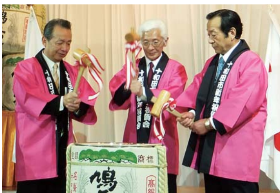
新年の門出を祝って鏡開き