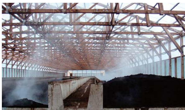
処理施設で糞を発酵堆肥へ。