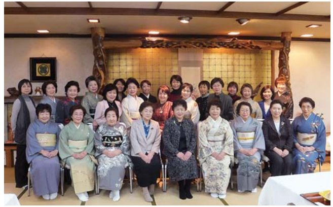
新年をみなさんと

会員のみなさんでいろいろなゲームで盛り上がり、中でもじゃんけん大会では、いつも負けている私が最後まで残り、会員の皆さんの喝采を浴びてしまいました。