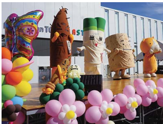
「ねぼっち」「にんにく」「ねざん」

そして、パワフルジャパン十和田のマスコットといえば「十和田ふぁみりーず」。彼らも十和田市の地名や産品のPRの力強い味方です。昨年は十和田市のイベントを中心に、県内外でパワフルに十和田をPRしてきました。