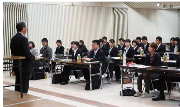
昨年の研修会の様子

日時 3月18日(月) 9:00～16:30 19日(火) 9:00～16:30 場所 十和田商工会館 1階ホール 受講料 当所会員事業所 1名 4,000円 非会員事業所 1名 6,000円 (テキスト、昼食代含む) 対象 新入社員及び入社2年目までの社員 定員 50名 締切 3月11日(月) まで