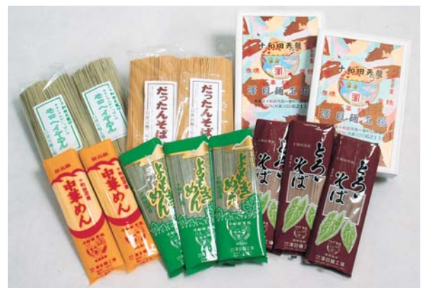
種類も豊富。澤目のめんラインナップ

種類も、事業開始当初から作り続けられてきた中華めんをはじめ、モロヘイヤやよもぎを使っためんなどバラエティ豊か。中でも“だったんそば”は十和田市産であり、地産地消にも取り組む。