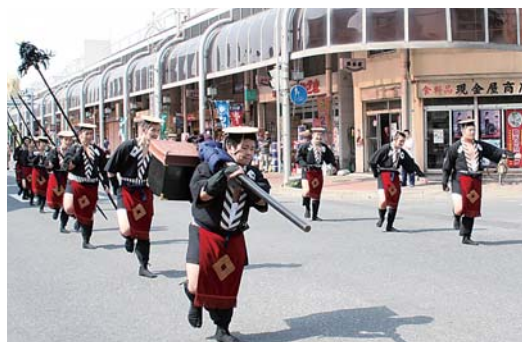
平成20年に行われたときの様子

問2. 十和田湖・奥入瀬溪流の国立公園指定に関わる功労者のうち、十和田保勝会を組織し、自ら会長を務めた人物は？