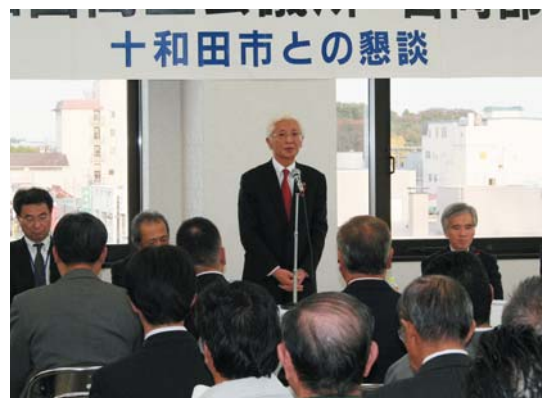
要望に対する十和田市の回答を受けるため、懇談会を開催

その内容は、会員事業所から構成される各部会より提案され、関係機関へ要望書を提出します。その後、回答結果に基づき実現に向けた事業を展開するとともに、新たな問題・課題への取り組みを検討していきます。