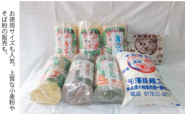
お徳用サイズも人気。上質な小麦粉やそば粉の販売も。