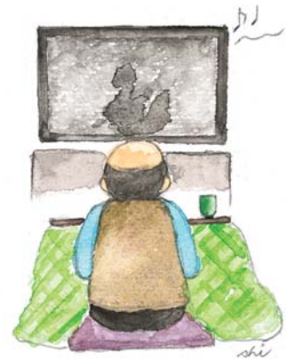
(協力 十和田かばちえっぼ川柳吟社)