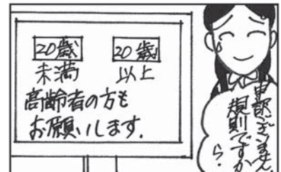
協力：のびのびマンガ教室（十和田）