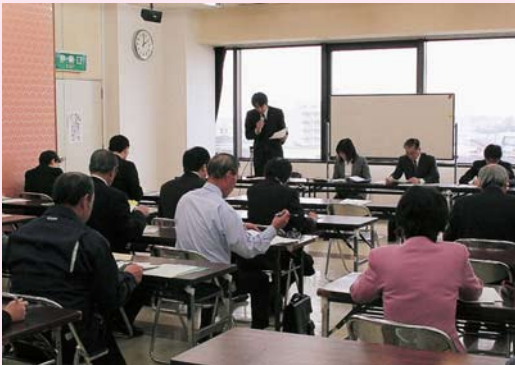
担当者からの説明を聴く参加者