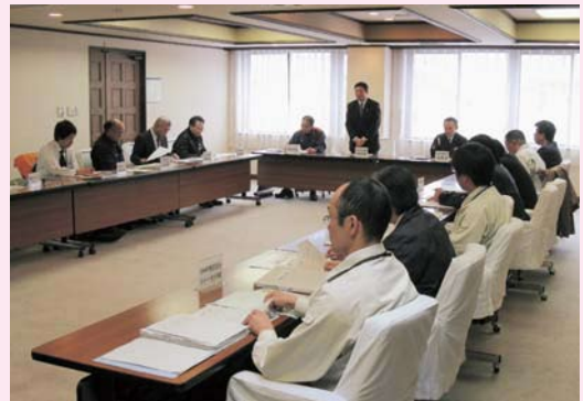
関係団体の担当者らが集まり会議が開かれた

4月19日、当所にて道路使用関係イベント会議が開かれ、今年度のイベントにかかる交通規制等の道路使用について話し合った。会議では、各イベントの主催者(主管団体)からイベントの概要や道路使用の期間や区間について説明。同席した十和田警察署及び消防署の担当者は「安全管理に徹底し、特に道路横断の際の交通事故に注意してほしい」と呼び掛けていた。