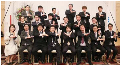
十和田青年会議所メンバー