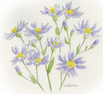
(協力 十和田かばちえっぽ川柳吟社)