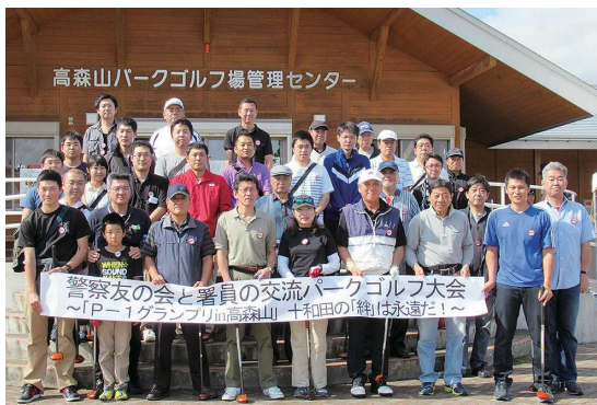
↑高森山パークゴルフ場で行われた大会 →好天にも恵まれハツラツとプレー