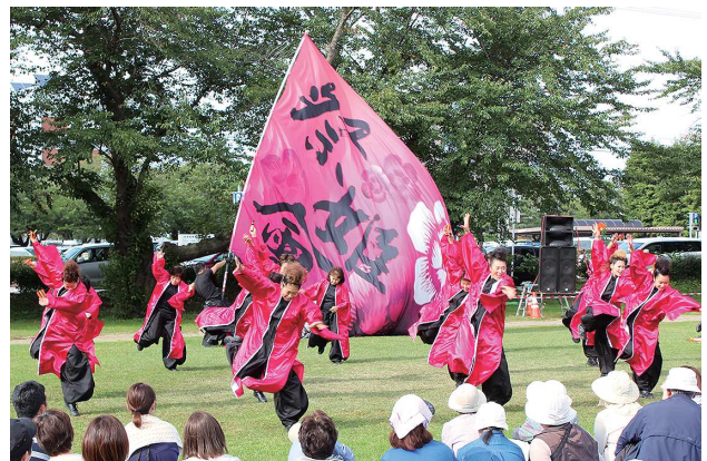
力強い演舞が観客を魅了(緑地公園会場)

とわだYosakoi夢まつりが、9月24日・25日に開催され、県内外から27チーム、総勢約700人が2日間にわたり躍動した。25日の本祭では、市役所(桜の広場)前及び緑地公園を会場に演舞が披露された。今回の目玉企画の保育園児によるスペシャルコラボ「100人園児」や北里大学・青森公立大学・弘前大学・秋田大学の4大学合同による特別企画・総踊り「青森の華」(制作:馬花道)なども行われ、会場を大いに盛り上げた。