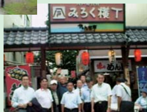
この日の夕食は、風情溢れる八戸屋台村みろく横丁の視察を兼ねて