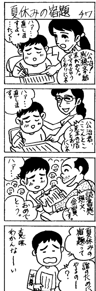
協力: のびのびマンガ教室(十和田)