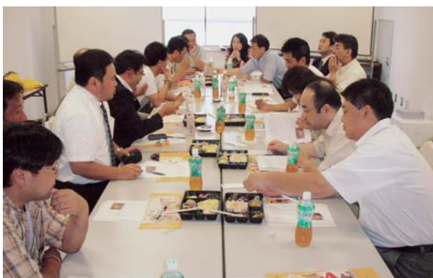
7月21日、北東北Aライン協議会が開催され、「え〜っ弁当」の試作品を吟味しながら、最終チェックをするメンバー。

このように、Aライン協議会の活動は、成功ばかりではありませんが、様々な手段や方法で目的達成のため知恵を出し合い、新たな発想が出てくるのも様々な業種のメンバーが参画しているからだと思います。組織が常に鮮度を失うことなく活動するためには、多面的で柔軟な発想が必要であり、そのためにも、異業種のメンバーが自由に意見交換できる場がAライン協議会です。今後も、様々な形で十和田の情報を発信し地域の振興に寄与できるよう努めて参ります。