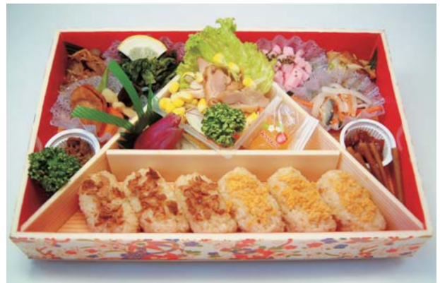
北東北Aライン協議会が東北ブロック八戸大会に合わせ完成した「え〜っ弁当」。大会参加者には、2日目の昼食に用意されている。

今年は、東北ブロック大会「八戸大会」への参加意識の高揚を図ることを目的に、大会記念弁当「え〜っ弁当」(9/22昼食用)を予約販売します。この