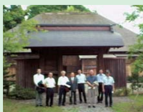
五戸町図書館に併設されている、往時の文化を偲ぶ五戸代官所前にて