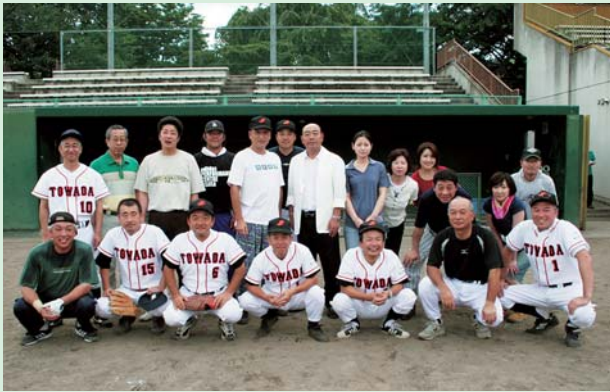
平成7年に三者で第1回の大会を開催し、平成9年から当所が加わって四者の大会となって以来、初優勝を飾った当所メンバー。