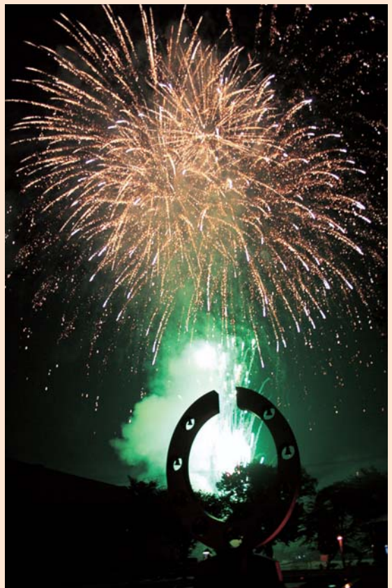
色とりどりの光の中に桜の広場のカリオンが、いっそう優美な姿で浮かび上っていた。